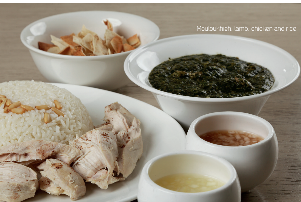
Mouloukhieh, lamb, chicken and rice

All platters are served with a side salad & dessert